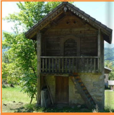
Grenier double au Chosal